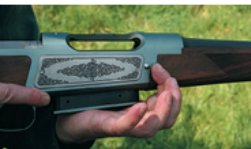
Dva pochrómované oblé výstupky po stranách puzdra záveru ovládajú vyberanie zásobníka.

Vyhadzovanie nábojníc je dobré. Vyhadzovacie okienko má dosť zvláštny tvar umožňujúci s mini-