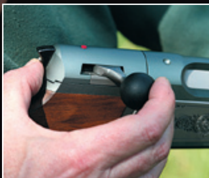
Otvoriť záver bez predchádzajúceho výstrelu je možné stlačením tlačidla.