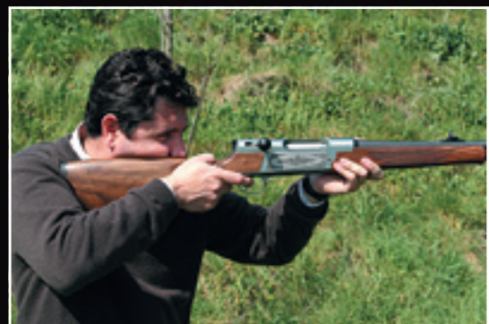
Dosadenie do ramena je dobré, naproti tomu spätný náraz je trochu cítiť.